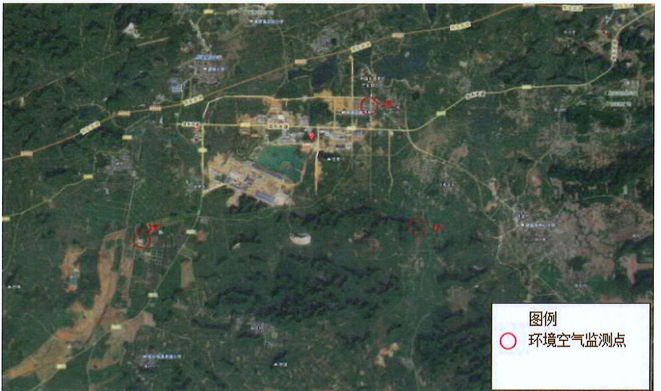
图 4-3 监测点位图