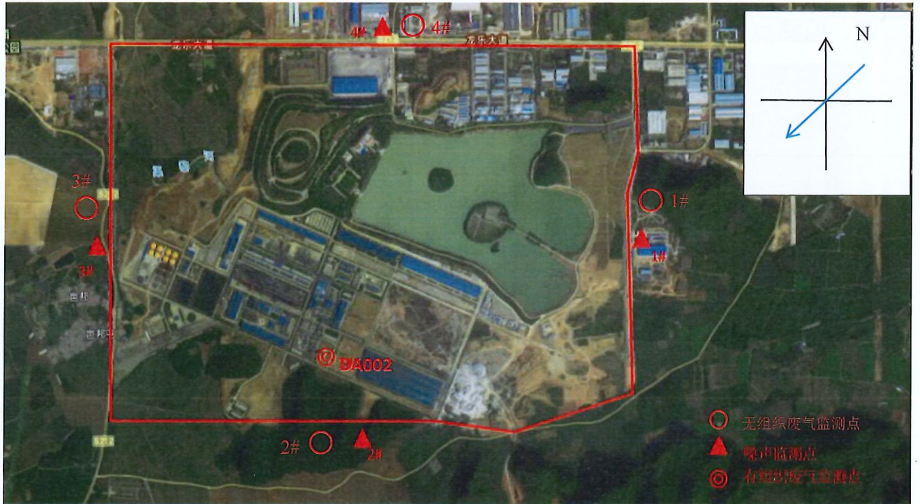
图 4-2 监测点位图