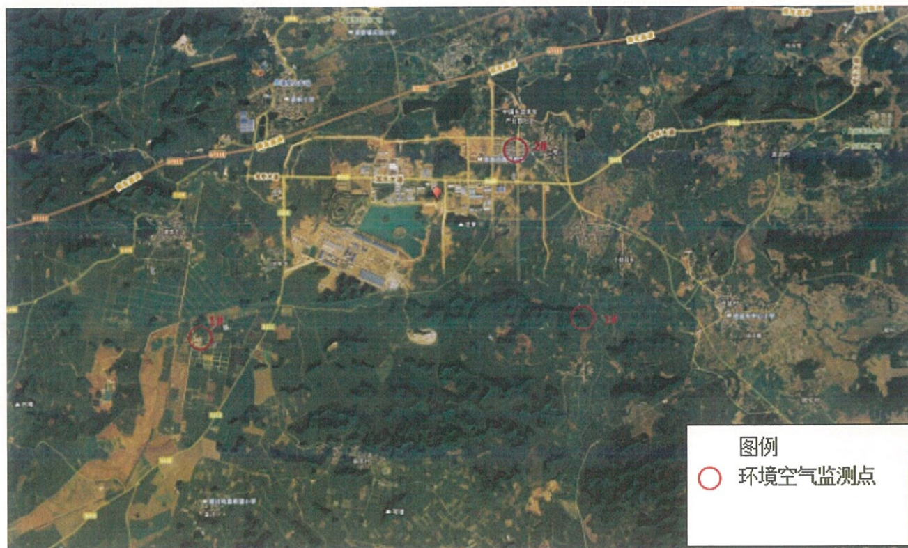
图 4-3 监测点位图