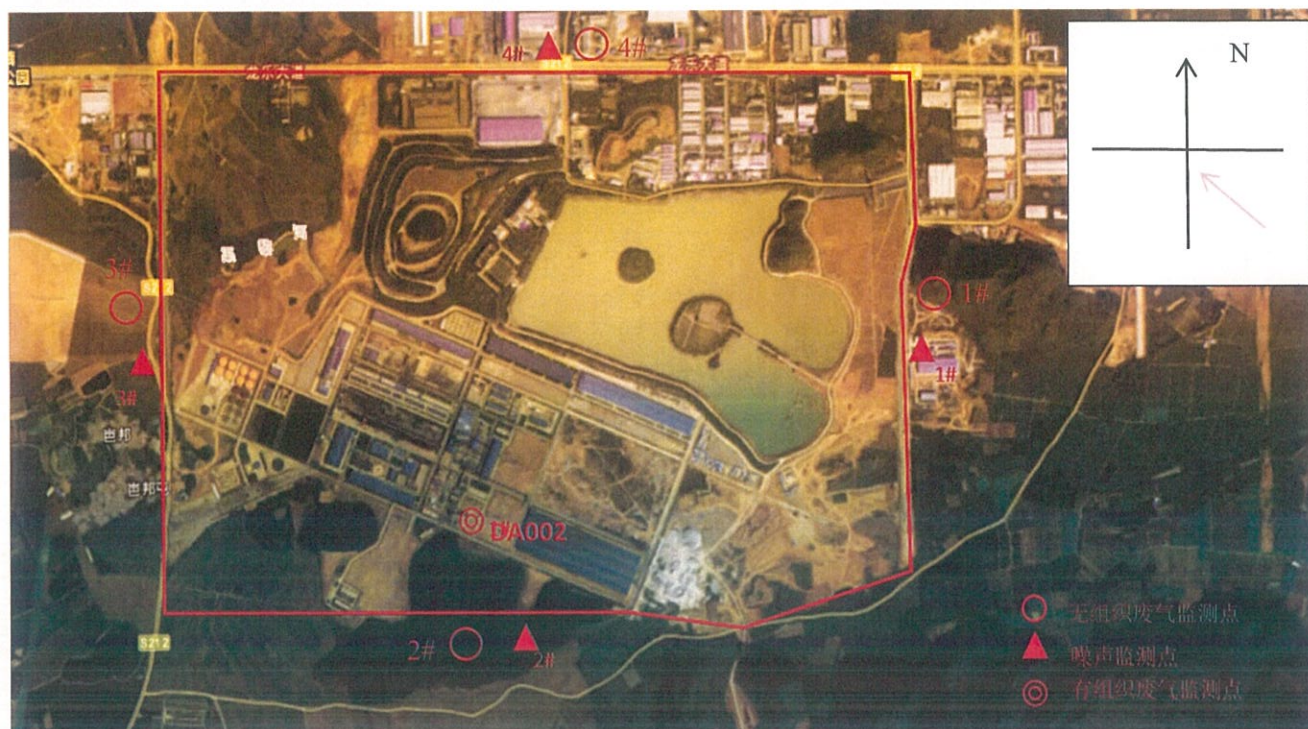
图 4-2 监测点位图